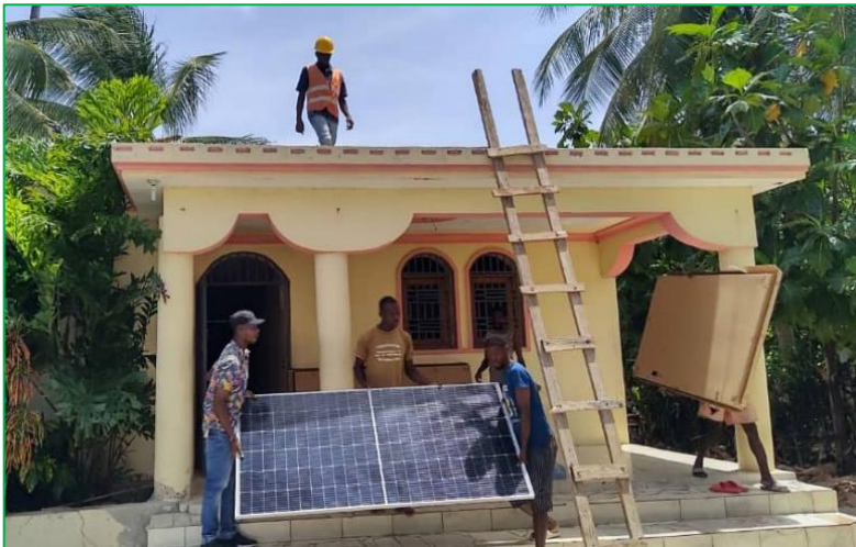
Installation d'un système de production d'électricité par panneaux photovoltaïques à la boulangerie de l'UCAD

Ce projet vise à renforcer une chaîne de valeur alimentaire par la production de farines locales destinées d'une part à la commercialisation et d'autre part, permettant de remplacer partiellement la farine de blé importée utilisée en boulangerie. L'initiative va contribuer au développement économique local et développer l'autonomie de la boulangerie de St-Jean-du-Sud tout en assurant une sécurité alimentaire renforcée dans cette région sud d'Haïti.