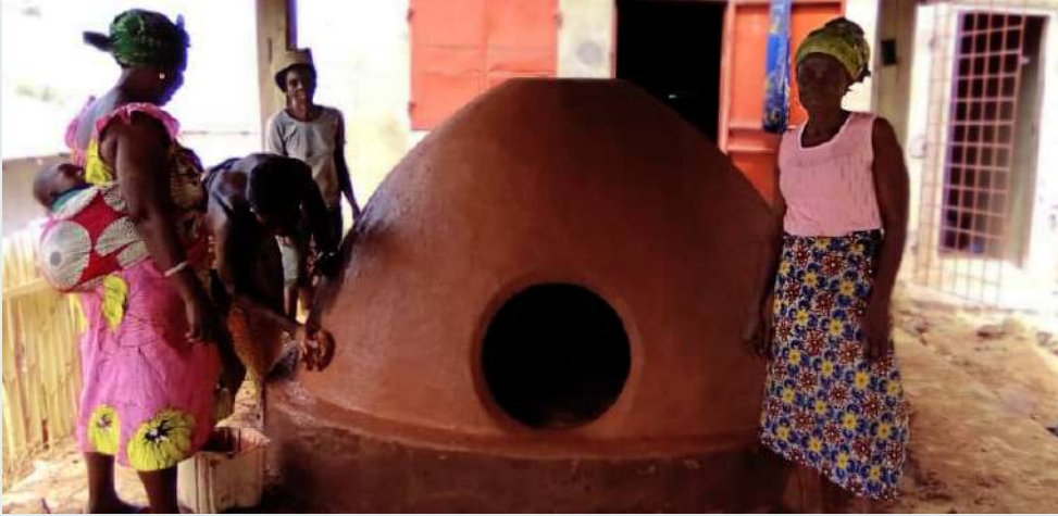
Le four traditionnel reconstruit par les habitants de Kuma Adamé