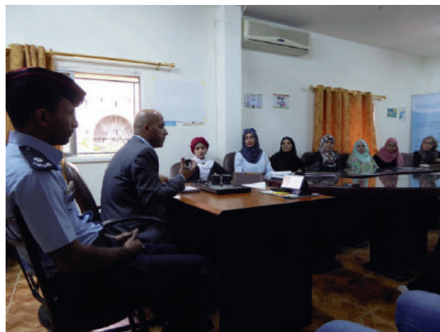
Séminaire sur l'islam Radical